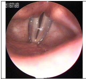
Εικόνα 2. Οίδημα των γνησίων φωνητικών χορδών, ιδίως της βέβης, σε λαιμική φωνή 34 ετών, που αποδείχθηκε με θερματικές δοκιμασίες ότι ήταν αλλεργικής αιτιολογίας, λόγω ευαισθησίας της στα ακάρεα της σκόνης του σπιτιού. Στις σκόνες 3 και 4 διακρίνεται ο ίδιος λάρυγγας σε διάφορες φάσεις της ενδοσκοπικής βιντεοστροβοσκόπησης

Το μπούκωμα της μύτης, που οφείλεται σε ρινική συμφόρηση μπορεί να επηρεάσει τις τονικές ποιότητες της φωνής, ενώ ο οπισθορρινικός κατάρρους μπορεί να οδηγήσει σε βήχα ή ερεθισμό του φάρυγγα[2]. Ένας τραγουδιστής με απανωτά συνεχή φταρνίσματα, κνησμό και ρινική καταρροή αδυνατεί να τραγουδήσει αποτελεσματικά.