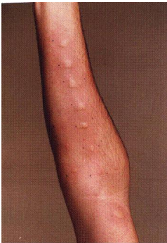
Εικ. 5. Ενδοεπιδερμικές δοκιμασίες νυγμού

Όμως, η ολοετήσια αλλεργική ρινίτιδα και το ολοετήσιο αλλεργικό άσθμα με συχνές κρίσεις, αρκετές ημέρες κάθε μήνα μπορεί να αχρηστεύσουν τη σταδιοδρομία τραγουδιστών και ανθρώπων που χρησιμοποιούν τη φωνή τους ως επαγγελματικό εργαλείο.