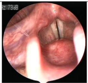
Εικόνα 4. Φωνητικές χορδές λαρυκού τενόρου 41 ετών. Την άνοξη παρασίαιε κρίσεις δυσφωνίας, φωνητικής κόπωσης, που τον παρεπόδίζαν να εργαστέ. Στο ιστορικό του ανέφερε άτυπα συμπτώματα αλλεργικής ρινίτιδας. Οι θεραπευτικές θεωμασίες βρέθηκαν θετικές για αλλεργιογόνα γάλακτος. Επέση υπό υπογλώσσια ανοσοθεραπεία και έπαφον τα ενσχλήματα την επομένη άνοξη.

δυσφωνία από μυική τάση (muscle tension dysphonia).