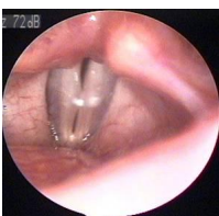
Εικόνα 4. □

Φάση της φωνητικής λειτουργίας της ασθενούς της □