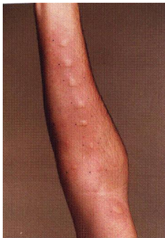
Εικ. 5. Ενδοεπιδερμικές δοκιμασίες νυγμού

Όμως, η ολοετήσια αλλεργική ρινίτιδα και το ολοετήσιο αλλεργικό άσθμα με συχνές κρίσεις, αρκετές ημέρες κάθε μήνα μπορεί να αχρηστεύσουν τη σταδιοδρομία τραγουδιστών και ανθρώπων που χρησιμοποιούν τη φωνή τους ως επαγγελματικό εργαλείο.