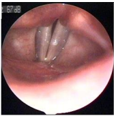
Εικόνα 3. Φάση της φωνητικής λειτουργίας της ασθενούς της εικόνας 2.

Υπάρχουν αλλεργικοί ασθενείς οι οποίοι πάσχουν από το στοματικό σύνδρομο αλλεργίας , που συνοδεύεται από κνησμό και οίδημα ποικίλου βαθμού στην στοματοφαρυγγική κοιλότητα. Οι ασθενείς αυτοί είναι ευαίσθητοι σε ορισμένα φρούτα και άλλα τρόφιμα. Το σύνδρομο αυτό προκαλεί δυσφωνίες.